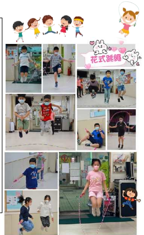
「今日小趣味」 day is a happy day